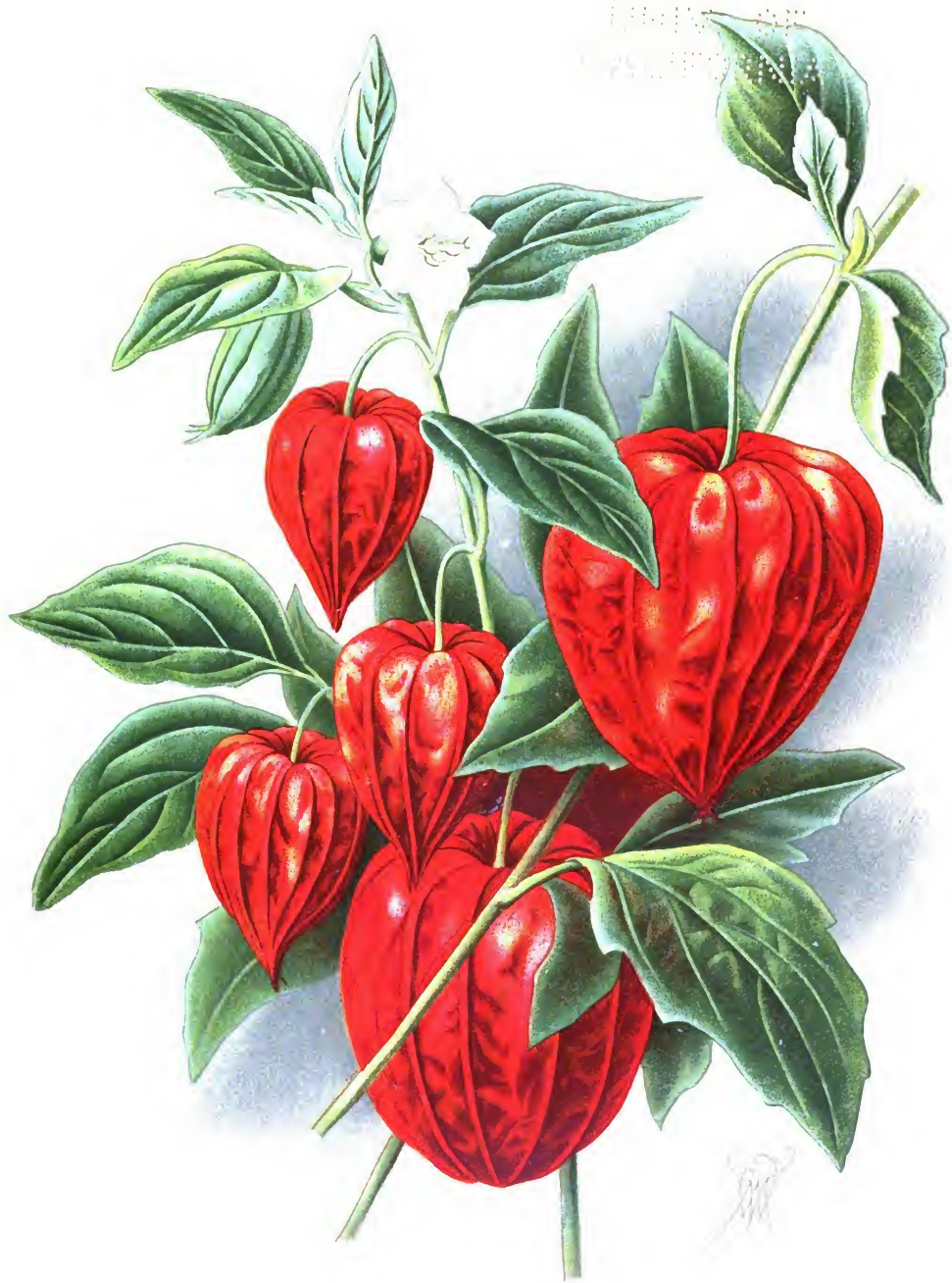
Physalis Alkekengi et Ph. Francheti.

Мохунка или жидовская вишня обыкновенная и М. японская.